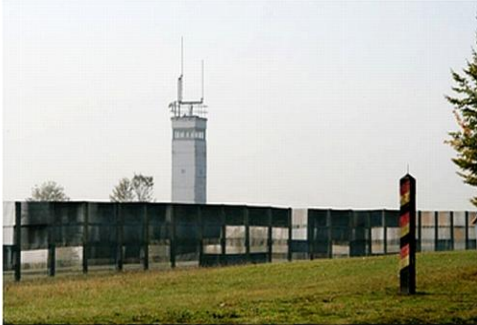
Abb. 5: Die Grenze von Imperium und Hegemonie an der deutsch-deutschen Grenze

Die Sowjetunion ist in diesem Ausscheidungskampf unterlegen, das sowjetische Imperium ist überstürzt auseinandergebrochen. Die Reformen Gorbatschows hatten keine Zeit und vermutlich auch keine Chance, sobald der Deckel der Pandora geöffnet und der Druck aus dem Kessel gewichen war. Der anschließende Machtzuwachs der USA war ein relativer aufgrund des Machtverlusts des Konkurrenten. Der Fall der Mauer bedeutete zwangsläufig die Ausdehnung der US-Hegemonie auf die Territorien des ehemaligen sowjetischen Imperiums.